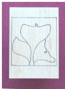
Efter døden. Et billede inspireret af bogen af samme navn

Små kors 7,7 x 10 cm. Dåbskors 20 x 26 cm. Eller efter opgave.