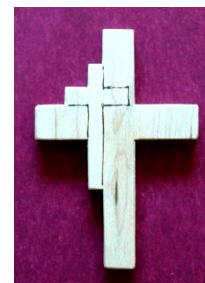
Dåbskors som dåbsgave