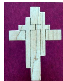
Bryllupskors som gave til to, der indgår i et harmoniserende forhold