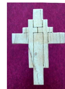
Røverkors Til brug ved skrifte. Kan minde om, at vi ikke er alene, samt Guds storhed