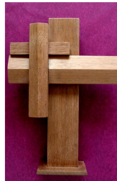
Dobbeltkorset er fremstillet i to udgaver. Begge udgaver kan anbringes på væg, eller på fod til bordbrug

Forhør nærmere om priser og valgmuligheder.