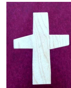
Kors for hånd og øje. Måske til ensomme på plejehjem