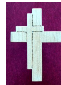
Konfirmandkors som et minde