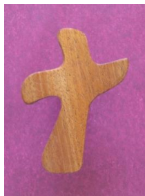
Bedekors. Bestilt til forbøn..