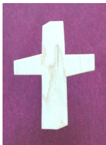
Kors for hånd og øje. Måske ved bøn..